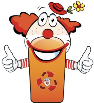
Mölmi Der jecke Müllschlucker